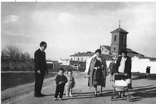
Familia pasea delante de la Iglesia La Blanca