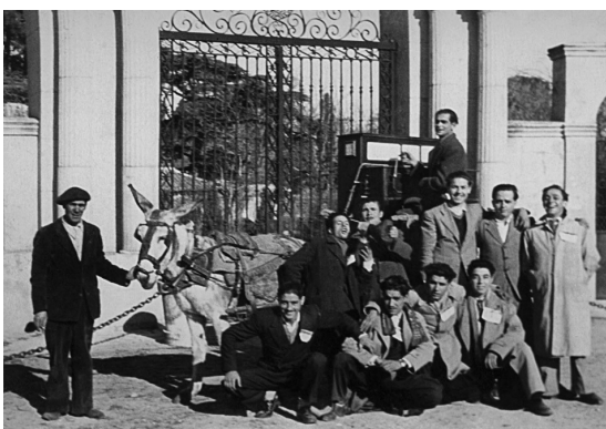
Los quintos posan en 1949

Son un total de 156 páginas que capturan fotográficamente cómo era aquel Canillejas en el que apenas existía la iglesia de Santa María la Blanca y la carretera de Aragón -sin casi edificios a su alrededor- por donde pasaba el arroyo que bajaba de la Quinta de los Molinos. Cobran especial relevancia las personas que poblaron aquel primer Canillejas, esas familias que hacían vida en los bares, peluquerías, comercios y las pocas calles que había hasta que tuvo lugar el desarrollismo en los años cuarenta y cincuenta del siglo pasado. Los tranvías, las costumbres, las fiestas tradicionales y religiosas y la vida en el campo, también tienen cabida en este libro que devolverá la nostalgia a muchos canillejeros.