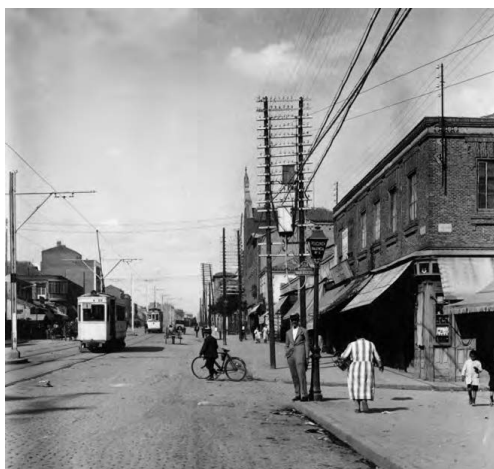
Bravo Murillo, años veinte

16x16 cm, rústica con solapas 200 imágenes 228 páginas 14,90 €