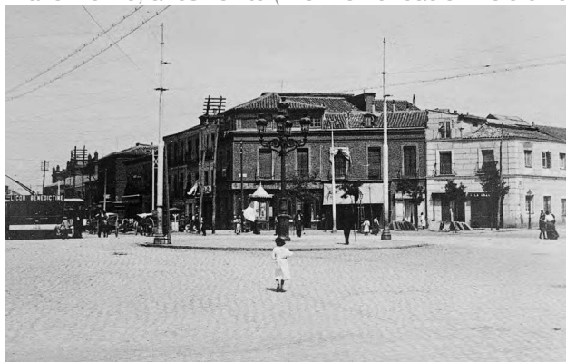
Glorieta de Cuatro Caminos 1912

Lo que hoy conocemos como el barrio de Tetuán tiene su origen en la guerra de España con Marruecos allá por el año 1860. Las tropas victoriosas del ejército de O'Donnell se asentaron en la Dehesa de Amanuel. De la necesidad de abastecer y ofrecer servicios al campamento militar surgió un nuevo barrio: Tetuán.