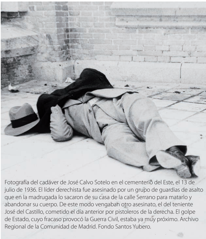
Fotografía del cadáver de José Calvo Sotelo en el cementerio del Este, el 13 de julio de 1936. El líder derechista fue asesinado por un grupo de guardias de asalto que en la madrugada lo sacaron de su casa de la calle Serrano para matarlo y abandonar su cuerpo. De este modo vengaban otro asesinato, el del teniente José del Castillo, cometido el día anterior por pistoleros de la derecha. El golpe de Estado, cuyo fracaso provocó la Guerra Civil, estaba ya muy próximo.