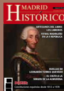
Retrato de Carlos III. Mengs, hacia 1765. Museo del Prado.