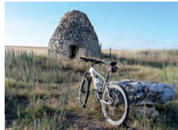
Chozo Paramillo de Callejas

Km 27,4. Aquí, en algunas ocasiones, hay una senda marcada sobre la orilla de la tierra de cultivo (izquierda) que nos facilita nuestro paso. Si no existe, debemos subir hasta la puerta del polvorín y allí pasar andando por un sendero a nuestra izquierda en fuerte descenso y posterior ascenso que salva una vaguada, para poder llegar bajo el cerro del polvorín. Cogemos una senda a la izquierda que describe una gran curva a la derecha y se acerca a