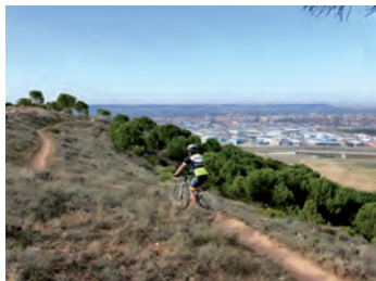
Vistas sobre la ciudad de Palencia

por el primer camino de la izquierda. Recorremos todo el páramo de Magaz (pasaremos al lado de un pozo) hasta llegar a la valla del monte de Villalobón.