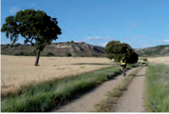
Pico Morilla y el Portillo

las repobladas laderas del monte. Se alternan rampas duras de subida a las cabeceras de los vallecitos, con descensos fuertes a los salientes donde hay que tener cuidado en las cerradas curvas, porque al ser las zonas más bajas se forman charcos y hay rodadas muy marcadas. Hay un punto (U.T.M. 377.961 - 4.648.689) en que tenemos la opción de ampliar la ruta 1 km más dando una vuelta extra al pequeño cerro que hay a nuestra izquierda, siguiendo el mismo tipo de camino que lo recorre, primero en bajada y luego en subida.