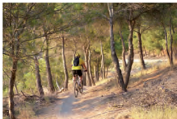
Ladera Cinco Picos

un pinar, en el que nos internamos hacia la izquierda por un sendero que va subiendo poco a poco hasta una curva de 180° a la derecha, donde comienzan rampas muy exigentes. Enseguida desembocamos en otra senda a media ladera (U.T.M.: 376.248 - 4.649.045) que seguimos a la izquierda.