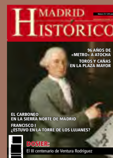
Retrato de Ventura Rodríguez, 1784. Goya. National Museum of Estocolmo.