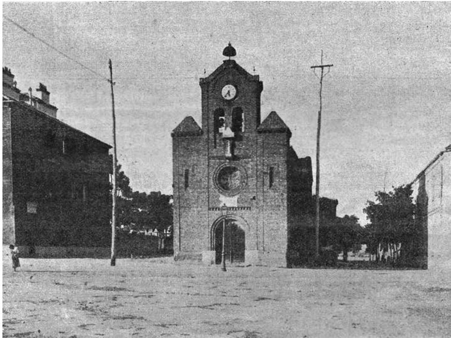
Fotografía de la iglesia de Nuestra Señora del Pilar. ABC, 1906.